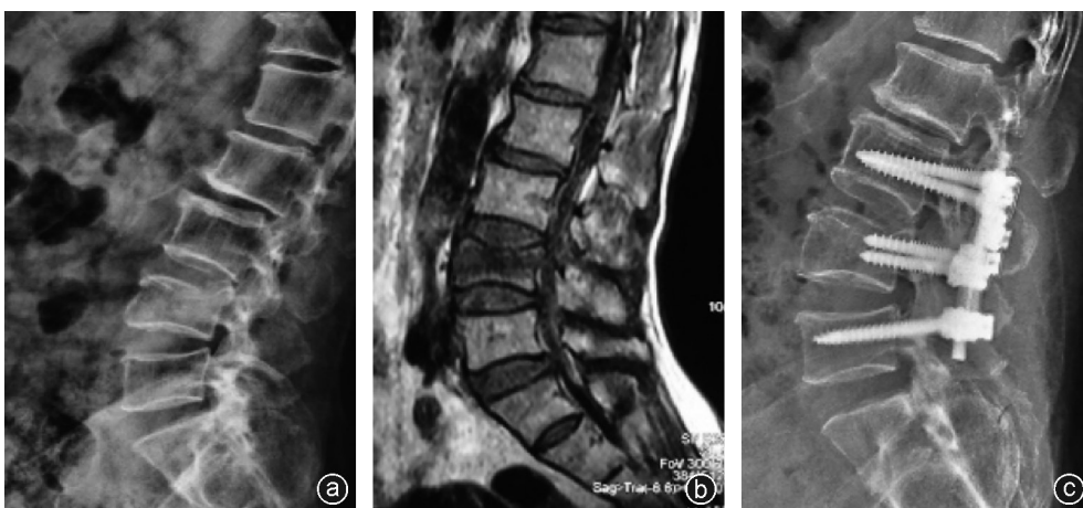
图3 病人,女,65岁,因外伤后腰背部疼痛活动受限4 d就诊,行切开复位植骨融合内固定术手术治疗 a:术前X线片示L 4 椎体上终板塌陷显著,椎体后缘可见游离骨块部分突向椎管;b:术前MRI示MRI T 1 像可见上终板中部塌陷显著,骨折线波及椎体后缘;c:术后X线片示L 4 椎体高度恢复,腰椎曲度良好