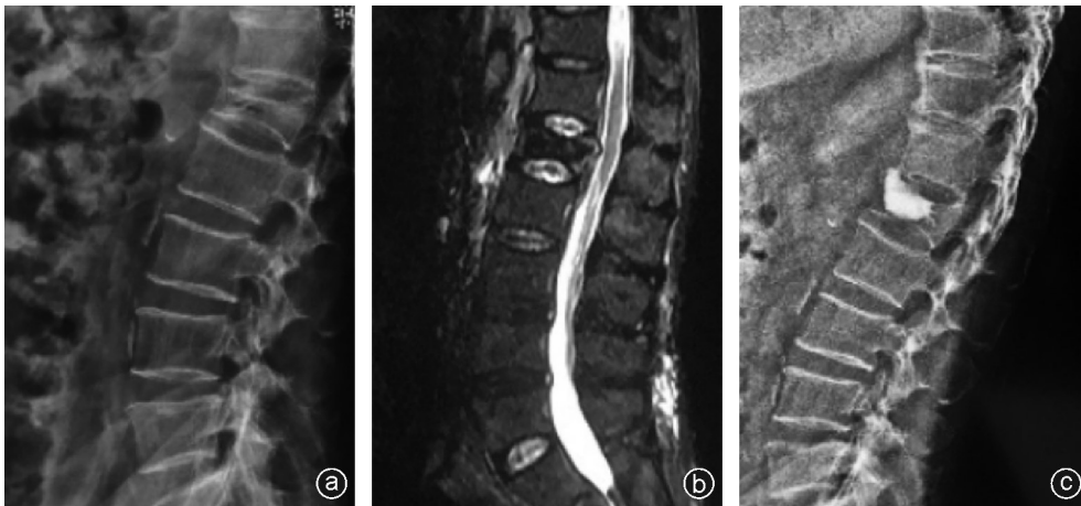
图1 病人,男,70岁,因外伤后腰背部疼痛活动受限3 d就诊,行PKP手术治疗 a:术前X线片示L 4 椎体前缘塌陷,椎体高度丢失,局部后凸畸形;b: MRI T 2 像可见L 4 椎体骨折,椎体后缘上部可见游离骨块突入椎管,硬膜囊未见明显压迫;c:术后X线片可见塌陷椎体高度有所恢复,局部后凸较术前有所改善,骨水泥填充良好,无明显渗漏